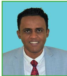
MHE. HUSSEIN MOHAMED BASHE (MB.) Naibu Waziri Kilimo