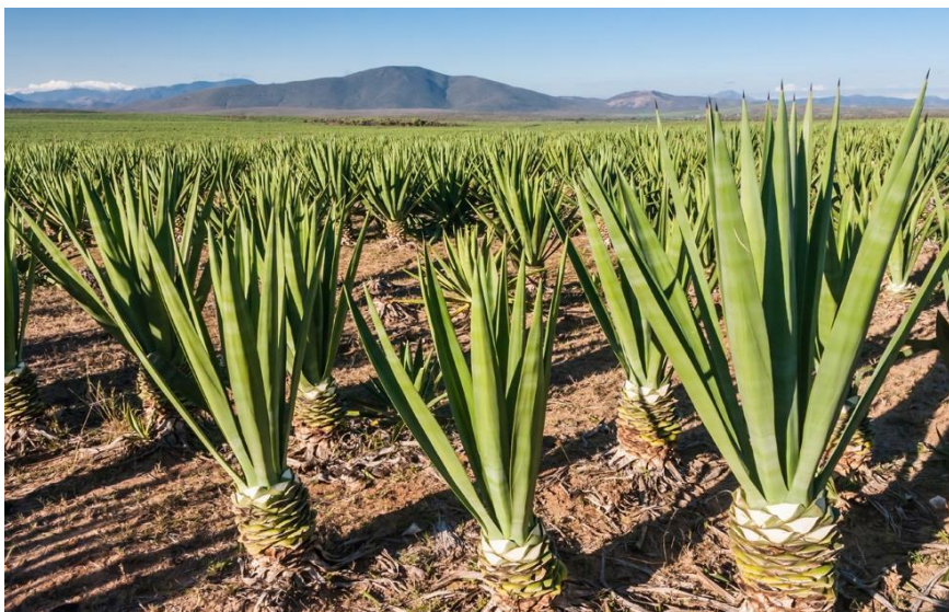
Eneo la kilimo cha mkonge limeongezeka

133. Mheshimiwa Spika , Bodi imeendelea kuongeza maeneo ya uzalishaji wa mkonge ambapo kufikia Machi 2019, hekta 5,529.50 zimepandwa mkonge mpya. Aidha, Bodi imesajili jumla ya wakulima wadogo wa mkonge 2,365 na wakulima wakubwa 22 sawa na asilimia 30.9 kwa wakulima wadogo na asilimia 100 kwa wakubwa. Vilevile, sekta ya mkonge imetoa ajira 129,022 kupitia mashamba na viwanda vya mkonge.