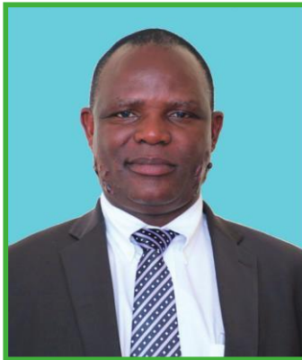
MHE. JAPHET NGAILONGA HASUNGA (MB.) Waziri wa Kilimo