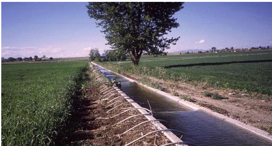
Miundombinu ya umwagiliaji imeendelea kukarabatiwa.

zimefikia wastani wa asilimia 78. Pia, ukarabati wa skimu 5 za mradi wa ERPP umefikia asilimia 51.