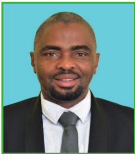
MHE. OMARY TEBWETA MGUMBA (MB.) Naibu Waziri Kilimo